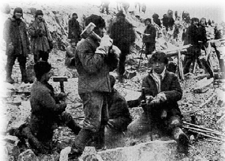
Więźniowie sowieckiego Gulagu pracujący przy budowie (Prisioneros del Gulag soviético trabajando en la construcción) ok. 1930

Según la documentación desclasificada en 1929 fueron deportadas 380.000 familias, lo que equivalía a dos millones de individuos; ante la resistencia surgida, miles de kulaks fueron condenados a muerte.