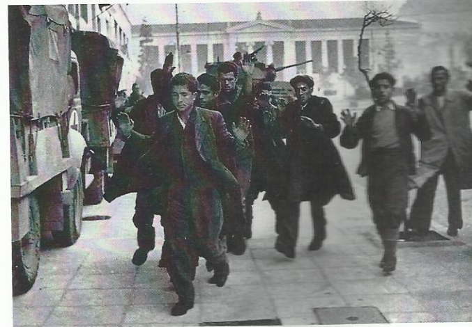
Los milicianos comunistas griegos gozaban de gran prestigio entre la población y contaban con amplias posibilidades de hacerse con el poder. Para impedirlo, se les combatió con las armas, se les detuvo, ejecutó o encarceló.