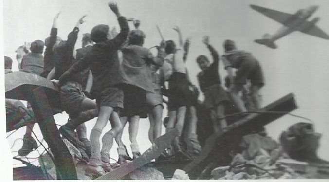
Durante el bloqueo de Berlín-Oeste llegó a haber mil vuelos diarios para abastecer a la población.