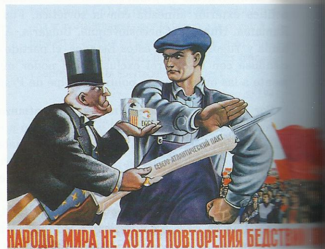
Caricatura soviética a propósito del Plan Marshall.