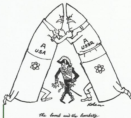
Entre los dos grandes. Caricatura italiana.

DEMOCRACIAS POPULARES Países que adoptan sistemas similares al soviético. Se autodenominan así para distinguirse de las democracias liberales.