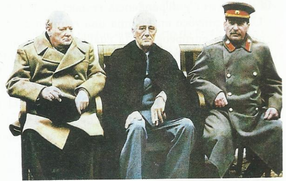
Churchill, Roosevelt y Stalin en la Conferencia de Yalta, 1945.

Por su parte, Estados Unidos , para afianzar su dominio en la Europa occidental, entre 1946 y 1948, obligó a expulsar a los comunistas de los gobiernos de coalición que se habían formado en muchos países (Francia, Italia, Bélgica y Dinamarca). Además, las potencias occidentales se esforzaron en impedir el avance comunista por Europa. Así ocurrió en Grecia en 1946 cuando, ante el temor al triunfo de las guerrillas comunistas (que habían tenido un papel esencial en la derrota del nazismo), las fuerzas británicas intervinieron para frenar su avance. Según la división de Yalta, Grecia pertenecía al bloque occidental y no se iba a permitir un incremento de la influencia comunista. El presidente Truman envió barcos de guerra al Mediterráneo oriental para mostrar su determinación de defender la región e impedir el paso de más países al bloque comunista.