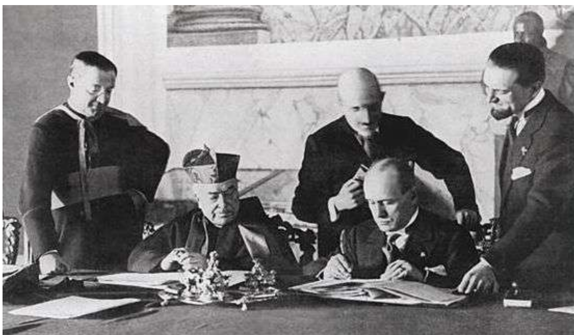
Firma del tratado de Letrán entre Italia y la Santa Sede.

Al llegar al poder los fascistas lo primero que hacen es pagar al gran capital los