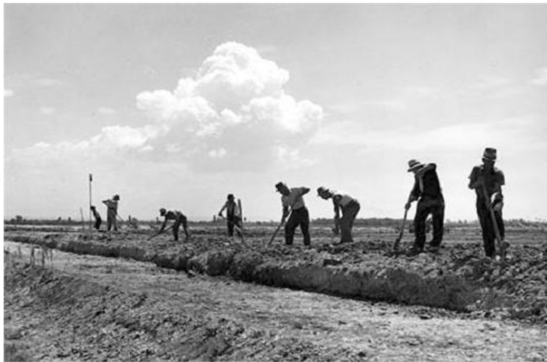
Las corporaciones sustituyen a los sindicatos de clase y ayudan al régimen a encuadrar y controlar la población.

1924. En 1924 Mussolini se hace también una ley electoral a su medida, en ella dice que el partido que obtuviese el 25% de los votos recibiría 2/3 de los escaños, así la oposición quedaba debilitada. El hecho más escandaloso de la violencia fascista fue el caso Matteotti , secretario general socialista que criticó la violencia fascista y el fraude en el recuento de votos, fue secuestrado y asesinado