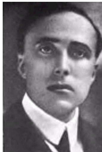
El asesinato de Matteotti.

Gobierno inicia una ofensiva contra los socialistas.