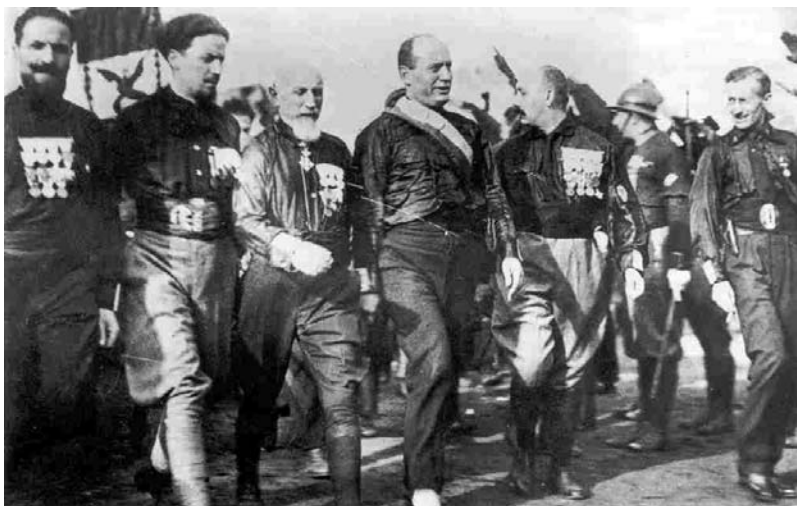
La Marcha sobre Roma, octubre de 1922.

el descontento de posguerra y funda en Milán los fasci di combattimento integrados por excombatientes, anarquistas, extremistas... y actuarán de forma violenta para reprimir huelgas y manifestaciones obreras. En el año 1920 al ocupar fábricas los socialistas y ante la impotencia del